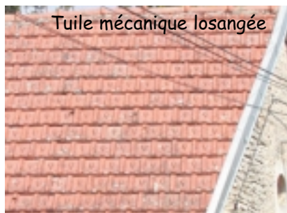
Tuile mécanique losangée