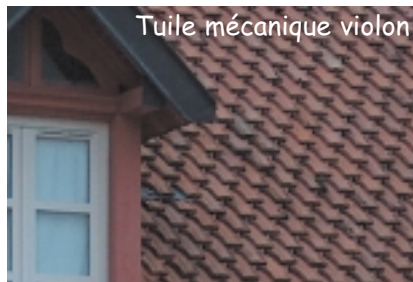
Tuile mécanique violon