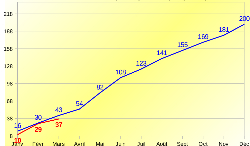
Accidents corporels (cumul depuis janvier)