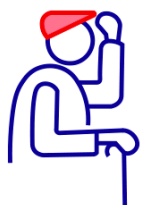
Personnes âgées de plus de 65 ans

Vague de chaleur : quelles sont les personnes les plus vulnérables ?