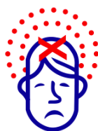
Maux de tête