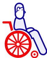
Personnes handicapées ou malades à domicile