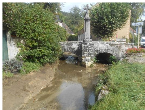
- avant et après travaux de gestion des dépôts sédimentaires -