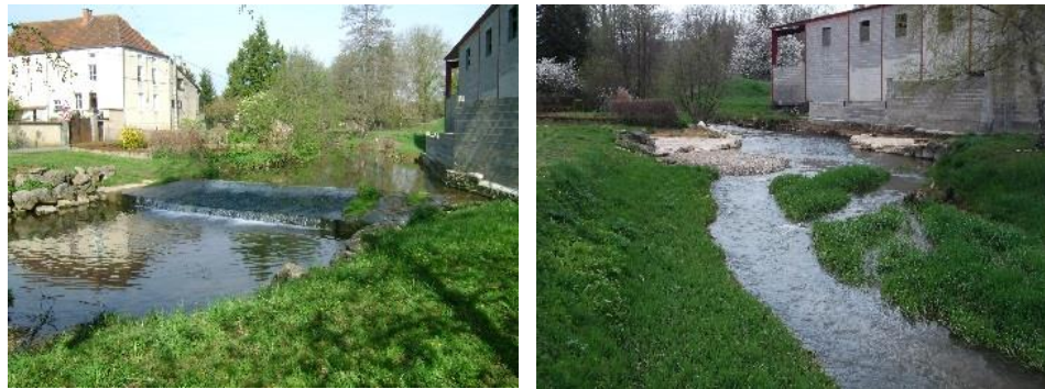
- exemple de réalisation similaire à Cheilly les Maranges -

- Restauration des fonctionnalités naturelles des cours d'eau par le rétablissement de la continuité écologique et sédimentaire.