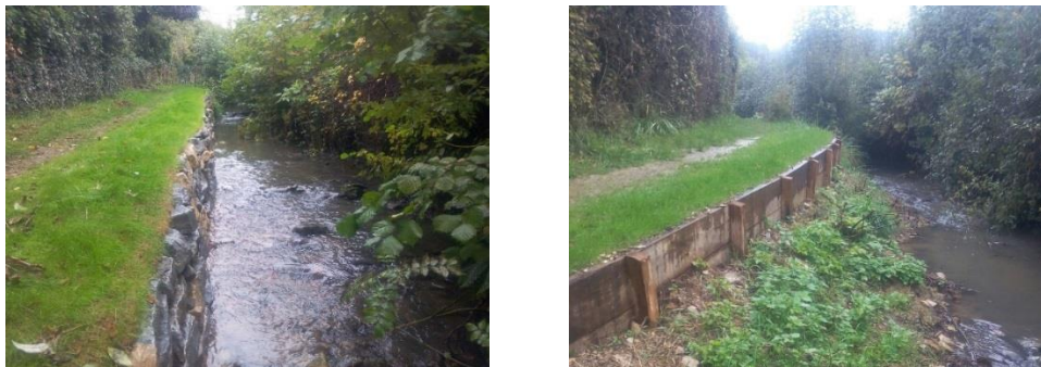
- exemples de réalisations similaires à Cormot Vauchignon -

- Stabilisation des berges érodées menaçant la sécurité des usagers