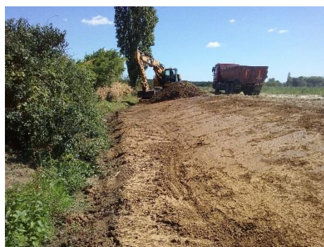
- exemples de réalisations similaires de restauration physique -