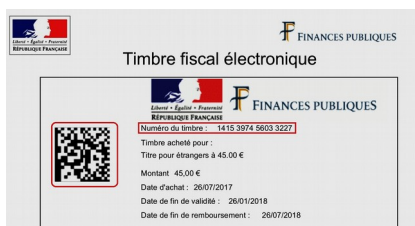
Timbre reçu par mail