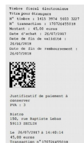
Timbre délivré par les buralistes